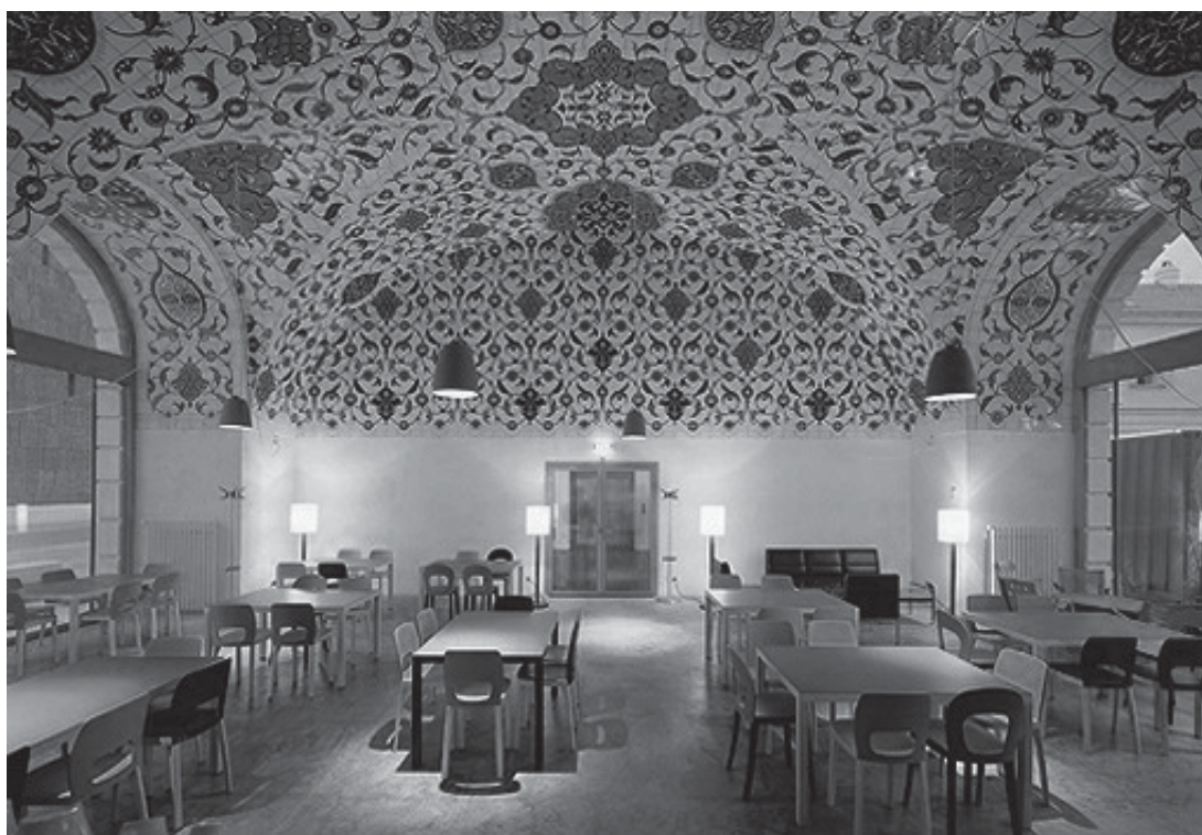
Кафе ресторан МИЛО, Центар за архитектура Виена © Rupert Steiner ( www.azw.at )

Café-Restaurant MILO, Architekturzentrum Wien © Rupert Steiner ( www.azw.at )