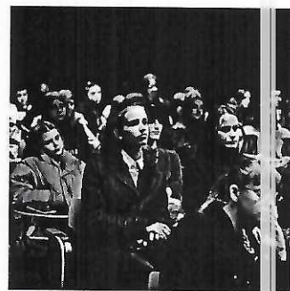
Прилог 3. Фотографија од предавањето