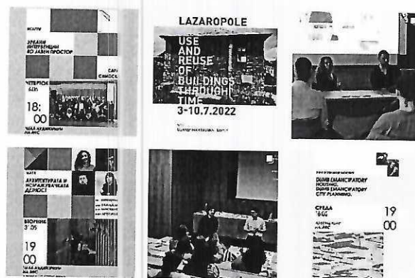
Прилог 6. Извадок од Instagram профилот на ФСС

Комисијата за комуникација и односи со јавноста ги предводеше социјалните мрежи на Факултетското студентско собрание. Бевме активни на профилите на Instagram и Facebook, како и на групите формирани со цел поажурно да комуницираме со сите генерации на Факултетот. Со оглед на активното учество на студентите на социјалните мрежи имавме одличен одзив за сите споделени информации а со тоа и голем интерес за сите активности кои беа организирани од страна на Собранието и Факултетот.