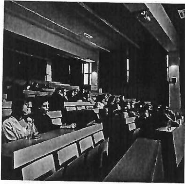
Прилог 5. Фотографија од првата филмска проекција

Дел од филмовите кои беа прикажани се “Koolhaas Houcelife” и “Tokyo ride” од режисерите Бека & Lemoine. Проекциите се одржуваа во среда од 18 часот во Амфитеатарот на Факултетот.