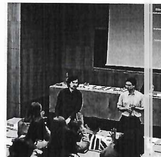
Прилог 1. Фотографија од предавањето на Биро Bietenhader Moroder